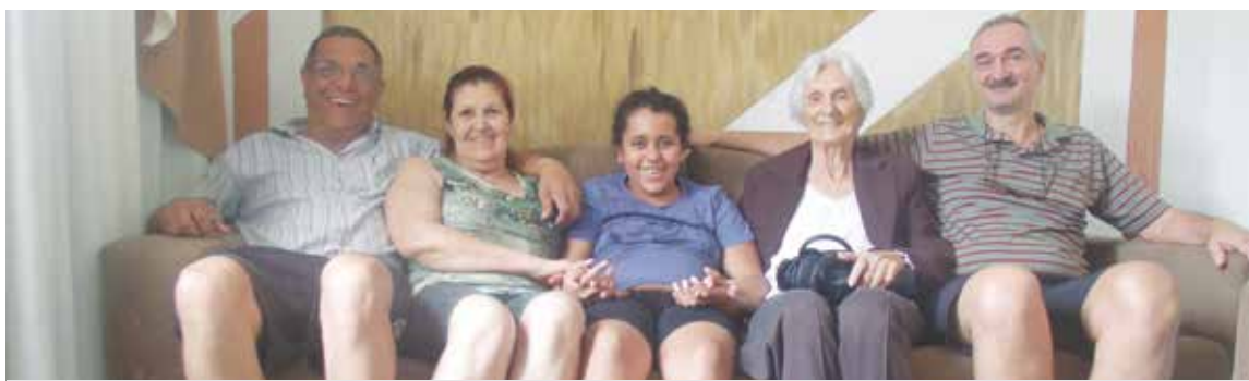
Natal de 2014