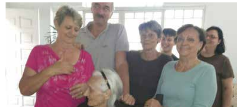
Festejando seu aniversário de 91 anos