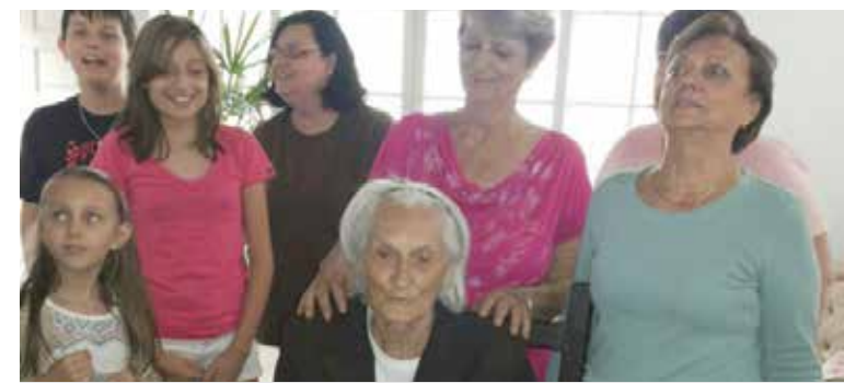
Comemorando aniversário com os filhos e netos